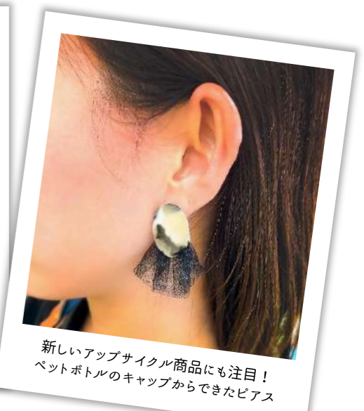
新しいアップサイクル商品にも注目！ ペットボトルのキャップからできたピアス