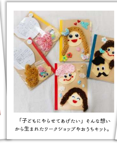
「子どもにやらせてあげたい」そんな想い から生まれたワークショップやおうちキット。