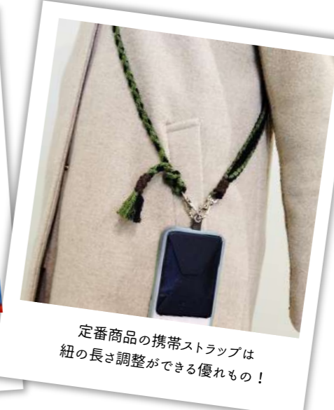
定番商品の携帯ストラップは 紐の長さ調整ができる優れもの！