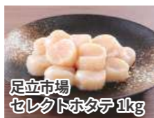
足立市場セレクトホタテ1kg