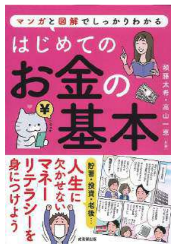
『はじめてのお金の基本 マンガと図解でしっかりわかる』 共著 / 頼藤太希 高山一恵 成美堂出版 2021年