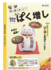
▲「ぱく増し」リーフレット

舎人センター1階エントランスにて、2/1(土)～2/28(金)の期間、ぱく増しに関連する本などを展示予定です。展示している本は貸出可能ですので、ぜひお立ち寄りください。