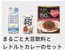
まるごと大豆飲料とレトルトカレーのセット