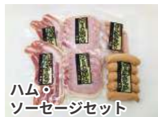
ハム・ソーセージセット