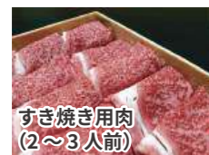
すき焼き用肉(2～3人前)

抽選で総勢50人にぱく増しできる商品プレゼント!皆さまのご応募をお待ちしております。