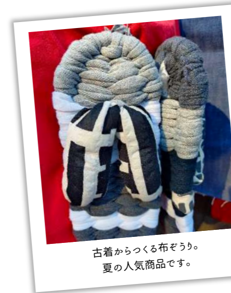
古着からつくる布ぞうり。 夏の人気商品です。