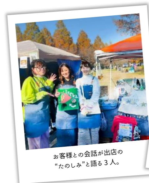
お客様との会話が出店の “たのしみ”と語る3人。

今後も人との関わりを大切に活動を目指すireka_shop。イベントなどで見かけた際はぜひお立ち寄りください。