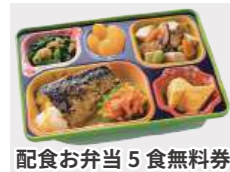
配食お弁当5食無料券