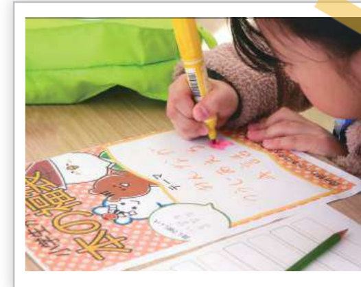
▲福袋のテーマを記入中

福袋のテーマは「うちゅうにはじめてであう人」や、夏休みの図書館員体験に参加した子どもによる「こども1日図書館員のおすすめ絵本」など、どれも読みたくなるものばかり。